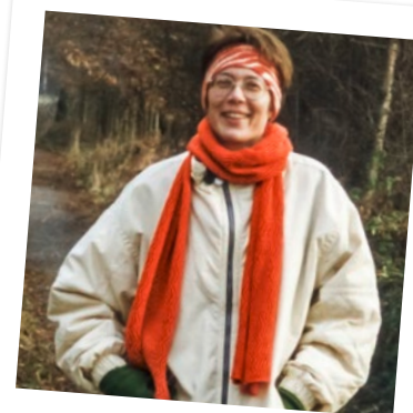
Vorher 1994: gestrickter Schal