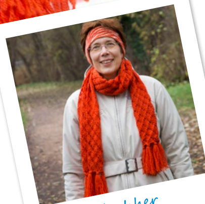
Nachher Aktuell: Schal gehäkelt